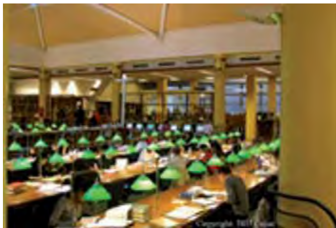
Salle de lecture de la bibliothèque Cujas

En ces matières, cette dernière possède l'un des fonds les plus importants de France, étant, de plus, CADIST (centre d'acquisition et de diffusion de l'information scientifique et technique) en sciences juridiques et pôle associé à la BNF. La volonté de la bibliothèque Cujas a été de donner toujours plus de moyens à son CR.